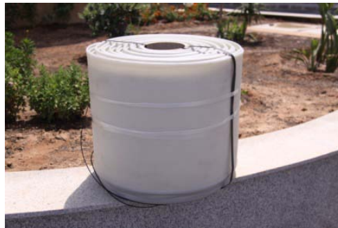
BOBINA DE REVLAM CANALETA

Se presenta en bobinas de 50 cm. de ancho y 2 hilos sintéticos soldados en los extremos y en toda la longitud de la lámina.